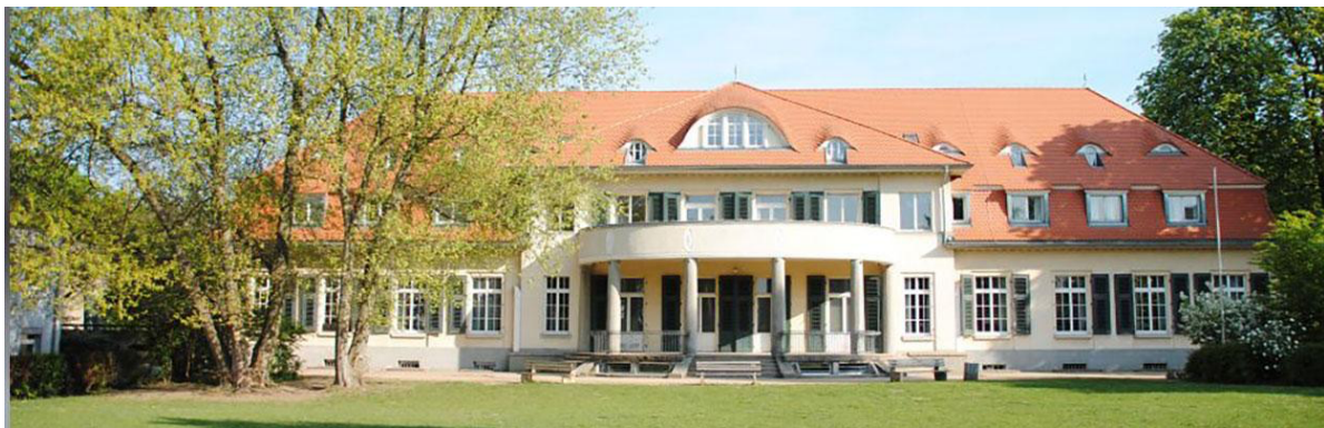
Haupthaus Schulzentrum Marienhöhe Darmstadt