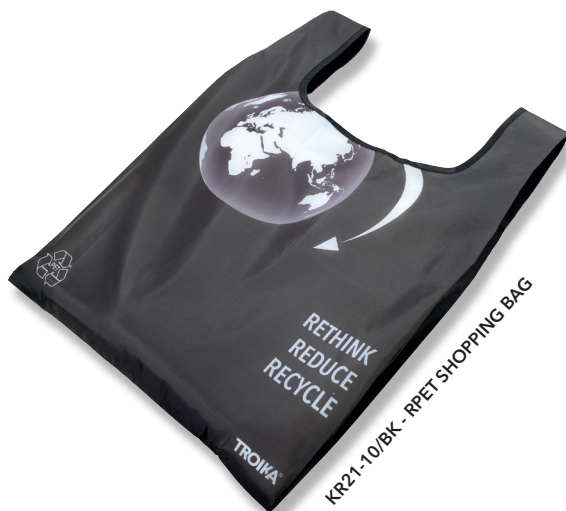
KR21-10/BK - rPET SHOPPING BAG