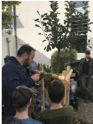
„Rebella“ bekommt auch ein Namensschild