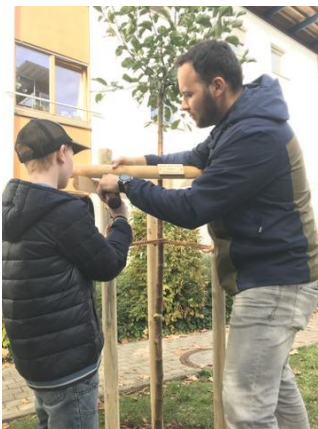
Das Landenberger For Future Team zeigte sich sehr geschickt